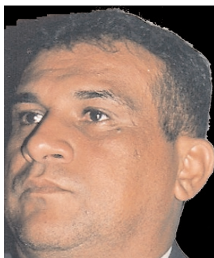
Por Sargento Azevedo

É com orgulho que faço parte desta entidade.