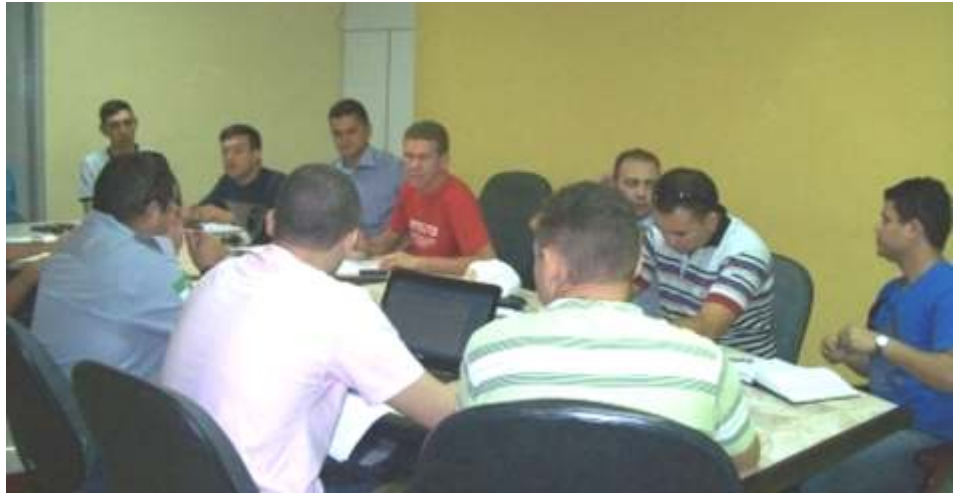
Reunião discute lei das promoções

Hoje, a corporação segue a Lei 5.142 de 13/09/1982 para aplicação de promoções, que está desatualizada. Por isso os militares estaduais estão juntos trabalhando para compor uma lei que atenda a realidade atual.