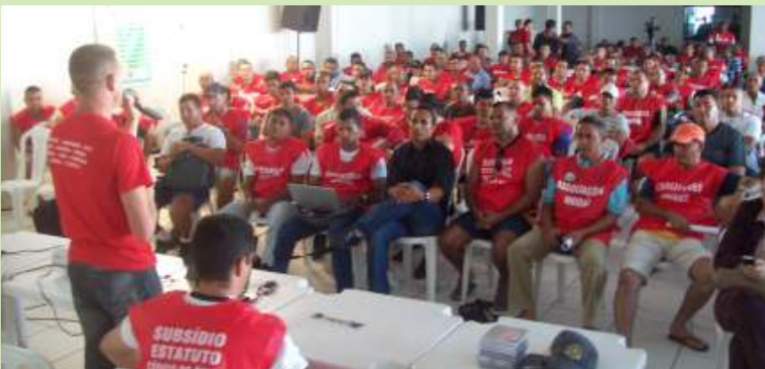
Assembléia sobre subsídio na ASSPMBM