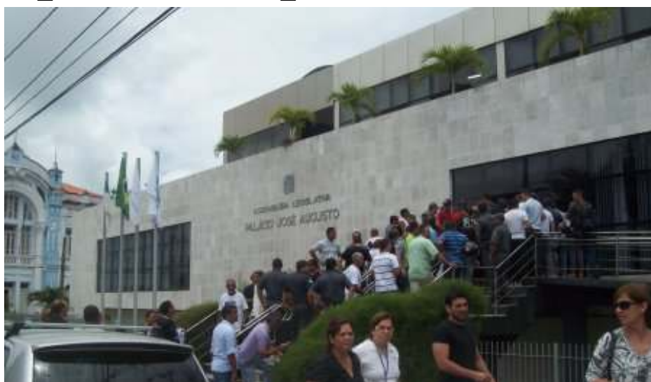
Mobilização na ALERN

Os policiais e bombeiros militares ficaram em Assembléia permanente e o Ato público foi mais uma ação do movimento por melhores condições de trabalho e salários. Os parlamentares abordados pelos representantes das entidades foram bastante receptivos a pauta dos militares. Dos 24 deputados 11 assinaram o recebimento das solicita-