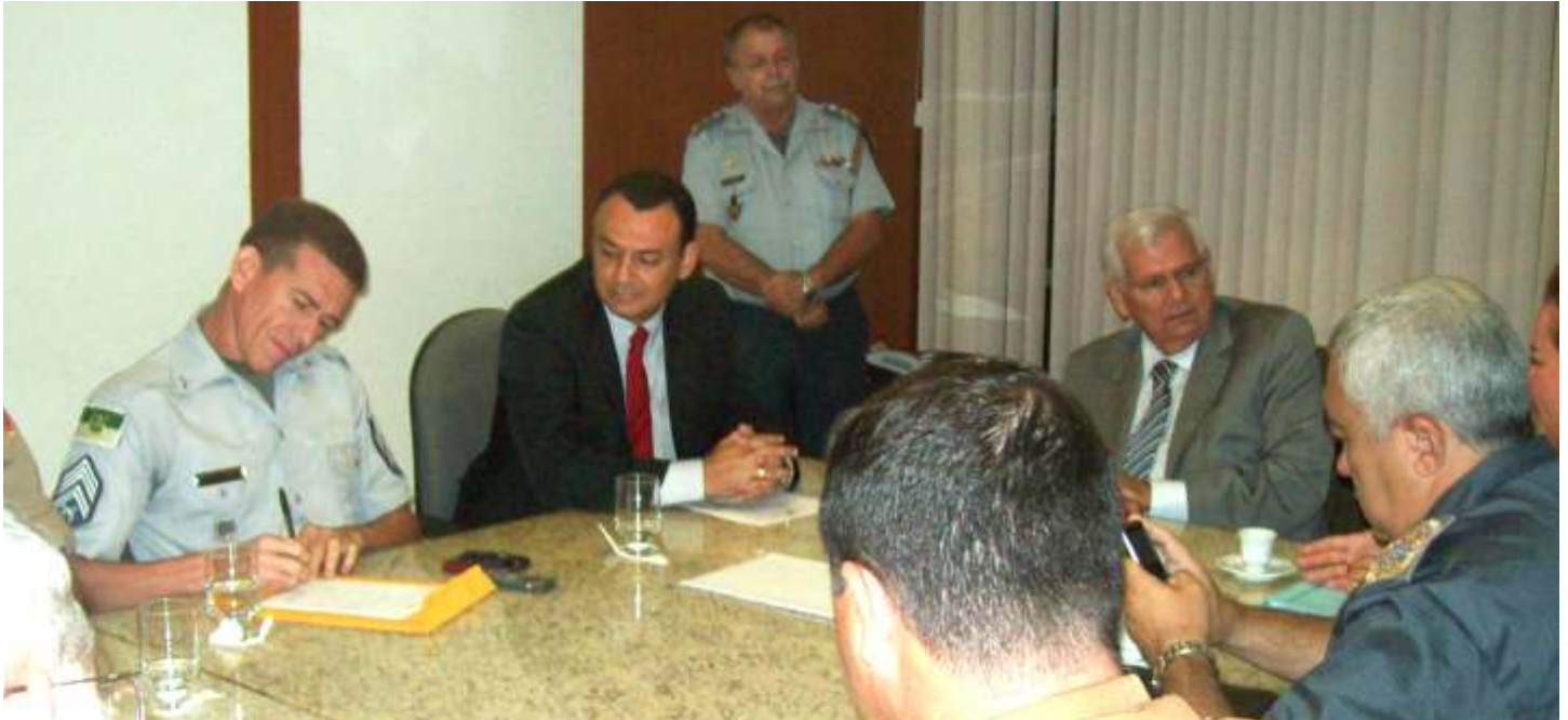
Negociação com o Governo sobre o subsídio